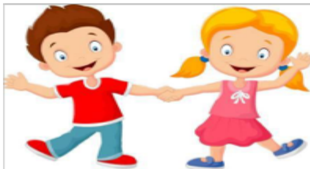
To sta OTROKA.