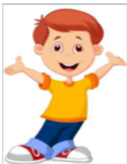
To je OTROK.