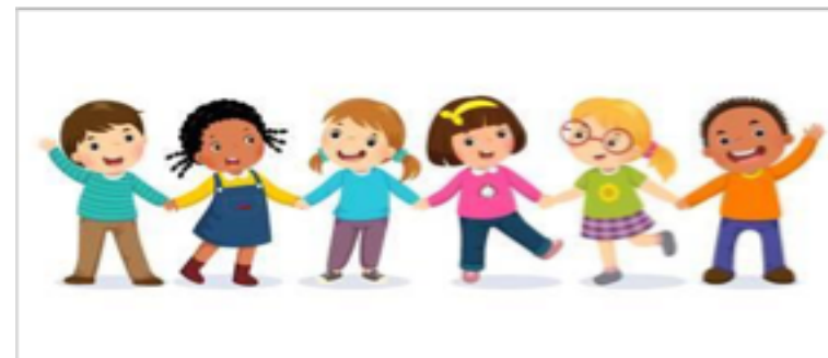
To so OTROCI.

ODGOVORI NA VPRAŠANJA in DOPOLNI POVEDI.