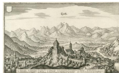
Škofjeloški grad iz leta 1649